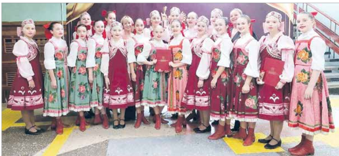
Ансамбль «Млада» – лауреат I степени

Ольга ПЕТРОВА