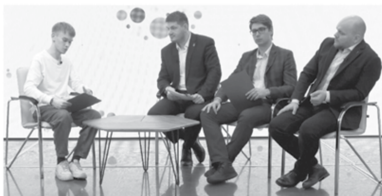
Неделя профилактических мероприятий объединила в себе круглые столы и социальные рейды в защиту подростков

Одним из главных мероприятий цикла стал круглый стол на тему профилактики экстремизма, прошедший в областном Доме дружбы. Здесь собрались более 100 человек, в первую очередь – представители системы образования. Вместе они