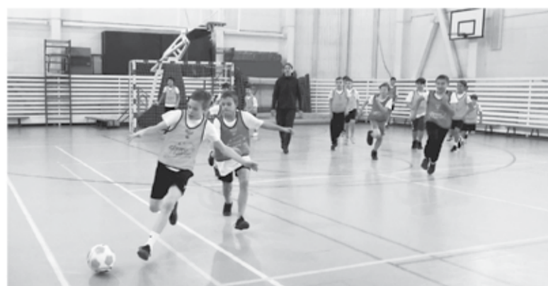
Игроки ФК «Ленинградец» научили школьников приёмам из большого футбола

По традиции всё начинается с разминки и теоретической части. Как правильно разогреться перед игрой? Как остановить мяч в два касания? Советы ма-