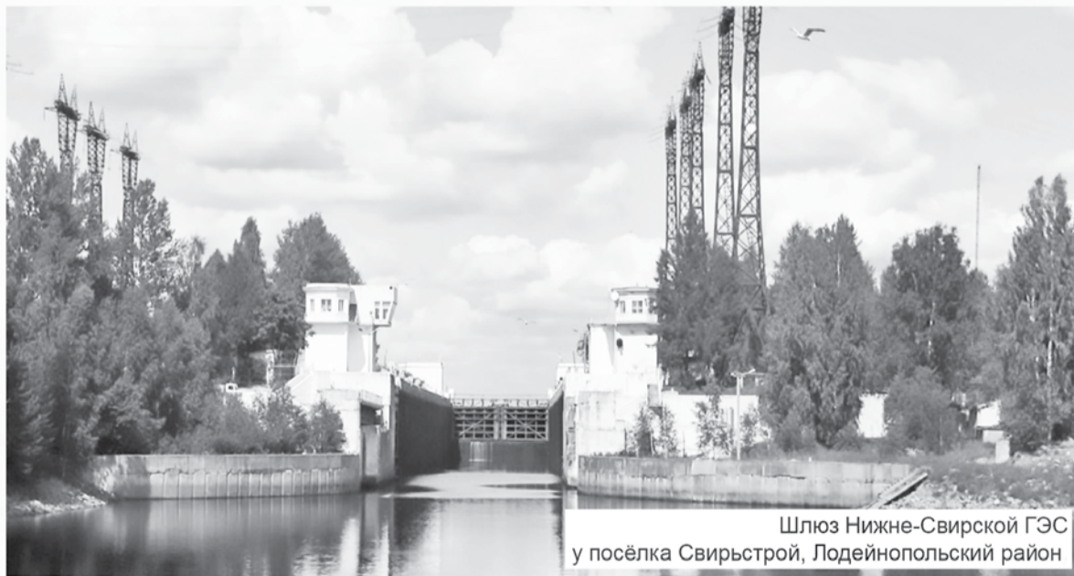
Шлюз Нижне-Свирской ГЭС у посёлка Свирьстрой, Лодейнополюский район

Нижне-Свирский гидроузел существенно улучшил условия