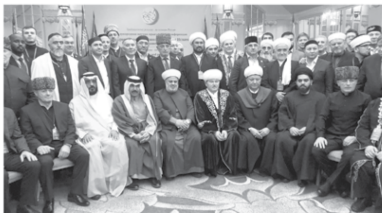
Участники конференции «Традиционные религии за сильную Россию»

История Ленинградской земли и ислама тесно переплетены. Еще в 16 веке земли под Бокситогорском получили дворяне из числа казанских татар. Активно вовлекал мусульман в государственные дела император Пётр Первый. К концу 19 века исламские общины проживали в Гатчине и Любани, Луге и Тосно. Связала нас и память о Великой Отечественной войне – в том числе о подвиге воинов-татарстанцев 2-й Ударной армии, павших при попытке прорыва блокады Ленинграда...